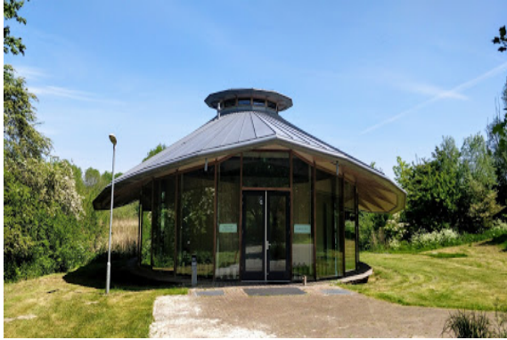
Gebouw De Waterlely